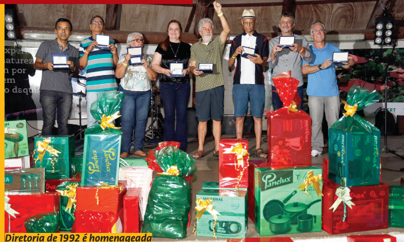
Diretoria de 1992 é homenageada