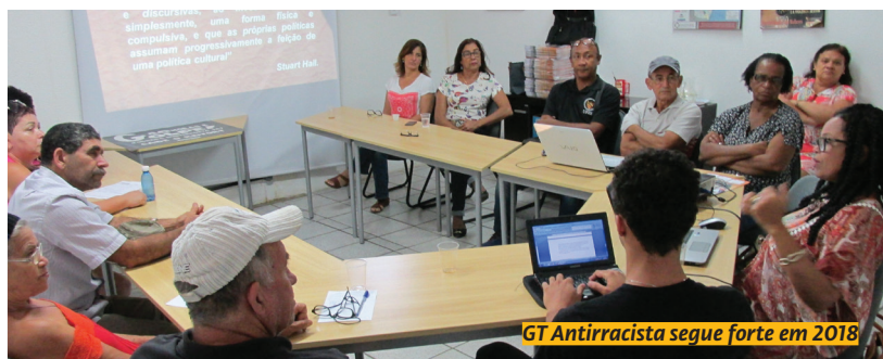
GT Antirracista segue forte em 2018

“São ações que vão seguir na agenda do sindicato, reforçando a colaboração do Sintufes com a promoção dos direitos humanos, contra o racismo, o feminicídio e as violências LGBTfóbicas”, aponta a diretoria colegiada do Sintufes.