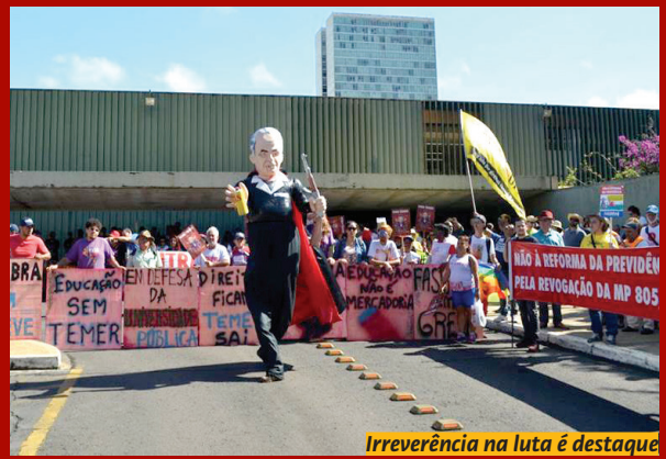
Irreverência na luta é destaque

Em 2017, o Sintufes completou 25 anos, seguindo a seu roteiro de luta e de destaque nacional no enfrentamento do desmonte do serviço público. Foi assim no dia 24 de maio, no Ocupa Brasília, que levou mais de 200 mil pessoas à capital federal, sofrendo forte repressão