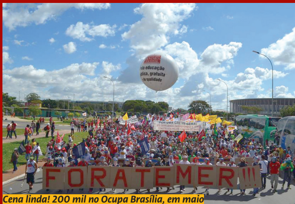
Cena linda! 200 mil no Ocupa Brasília, em maio

Sintufes se destaca nos atos nacionais e integra e puxa a criação de fóruns para fazer o enfrentamento conjunto