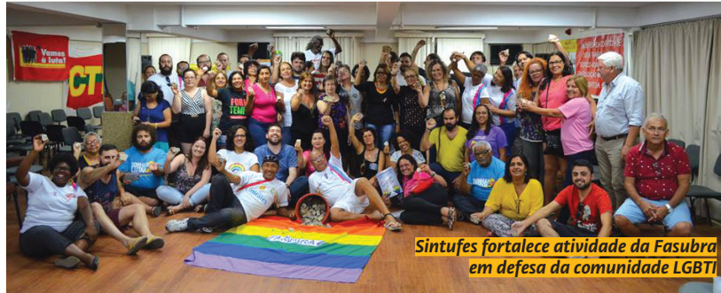
Sintufes fortalece atividade da Fasubra em defesa da comunidade LGBTI