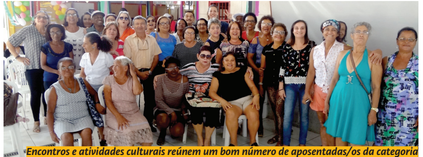
Encontros e atividades culturais reúnem um bom número de aposentadas/os da categoria

“Sempre que fizemos as convocações para os atos políticos e para as greves, as aposentadas e os aposentados atendem, participando em bom número, inclusive. E trazem na