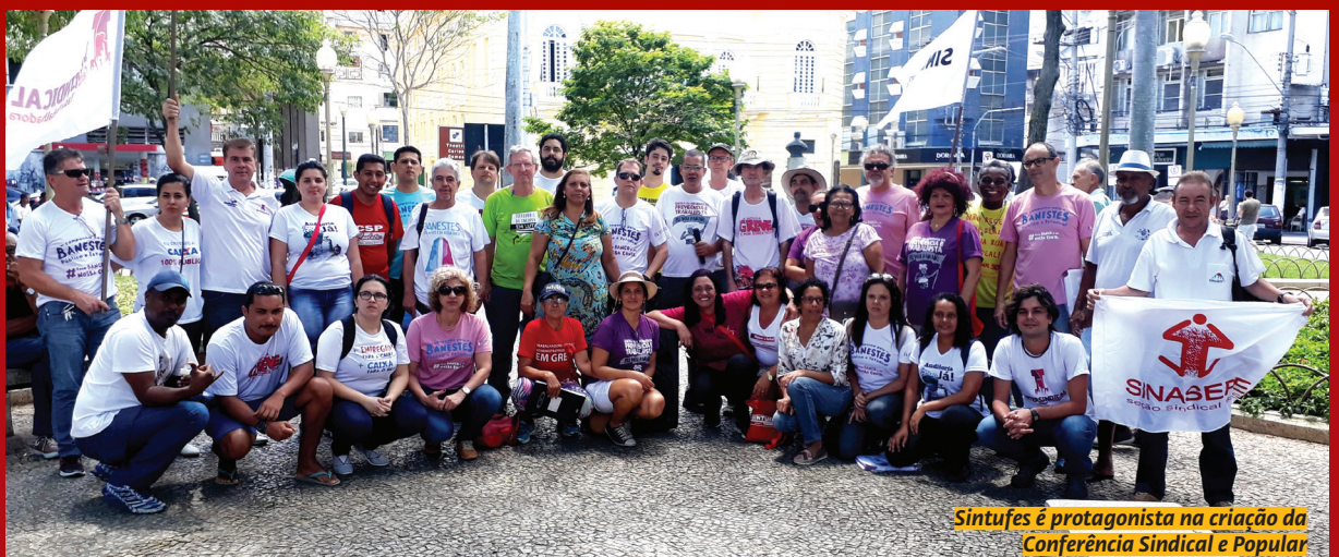
Sintufes é protagonista na criação da Conferência Sindical e Popular

arrancou a primeira reunião com o governo federal, após forte ato no Ministério do Planejamento, Desenvolvimento e Gestão (MPDG), no qual a irreverência do Sintufes – com cartazes e boneco gigante do ‘vampiresco Temer’ se sobressaíram. Esse ‘filme’ vai continuar em 2018.