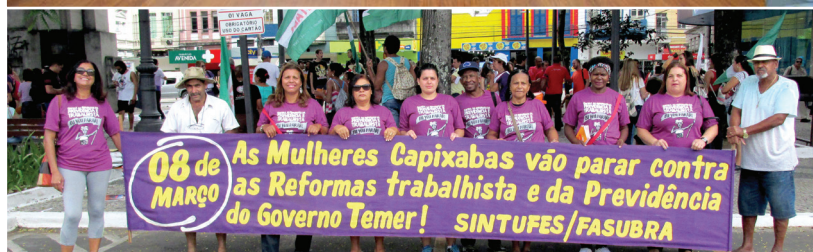
Sindicato sempre presente na luta das mulheres